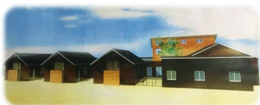
新院舎完成イメージ